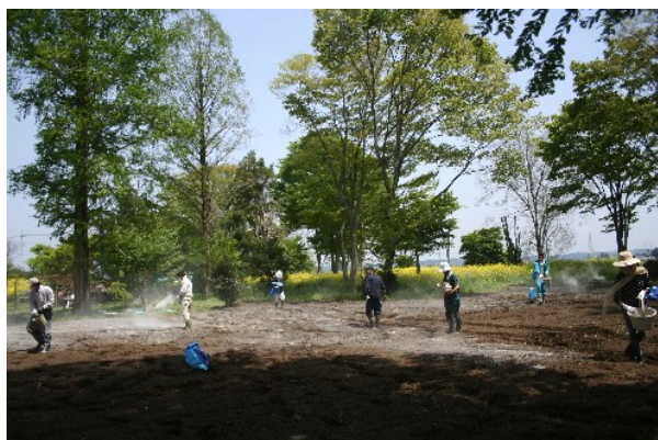
スタッフとボランティア・10名で ゲルマニウムや純天然有機ミネラルを散布

先日からお伝えしておりますように 5月2日に新しい畑「あいエコファーム1」を 400坪ほど増やしまして その畑の農地修正を行いました。 (その前の畑は、3月22日に修正済み)