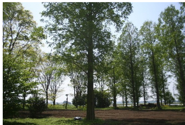
「あいエコファーム1」はこんなところ。木陰があって涼しい。 まわりは見渡す限りの田んぼです。