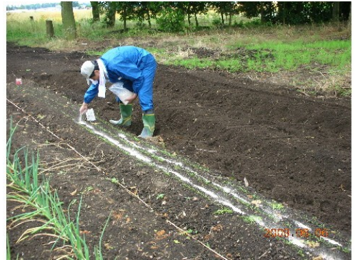
人参にゲルマニウム鉱石を散布

アミノ酸・・・シルク・竹炭主体のアミノ酸 350ml を1000リットルに希釈して散布