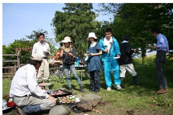
作業のあとはやっぱりバーベキュー！