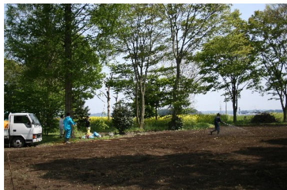
光合成菌入り磁場エネルギー還元水を1000リットル散布